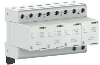
ETITEC SM T12 300/25 4+0 RC